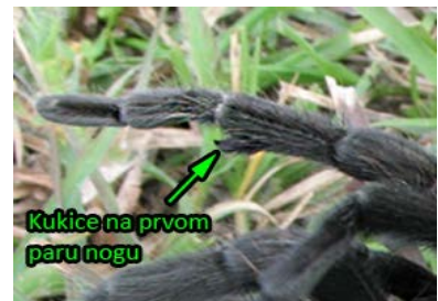
Kukice na prvom paru nogu

Kada su mlade tarantule u pitanju, mužjaci i ženke tokom odrastanja izgledaju gotovo identično, pa je jedini pouzdani način određivanja pola pregledom sveže presvučene košuljice iznutra, u predelu abdomena, pomoću lupe ili mikroskopa. Između gornjeg para listastih pluća, odmah ispod spoja abdomena sa cefalotoraksom, kod ženki se nalazi spermateka u vidu elipsoidne izbočine. Sa druge strane, kod polno zrelih jedinki, mužjake je